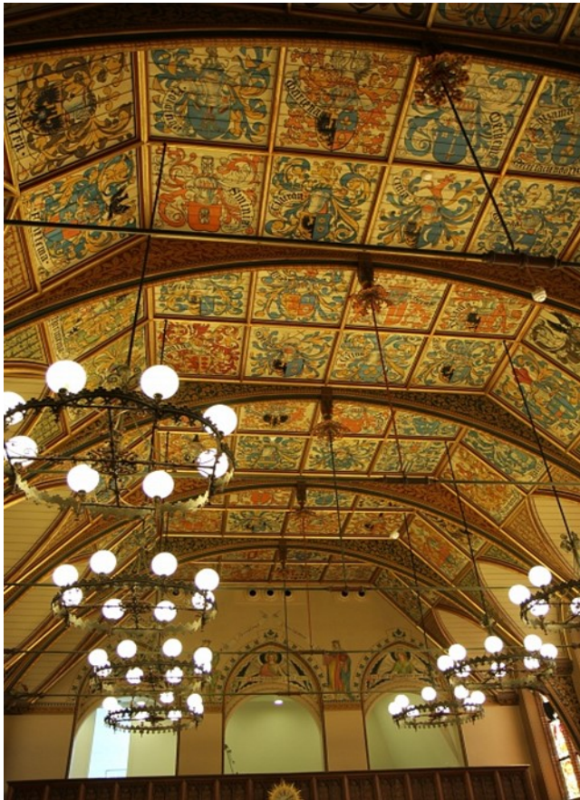
72 fakken mei de wapens fan geslachten fan grytmannen